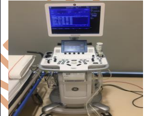
IMAGEN DEL ECÓGRAFO Y LA CAMILLA

El ecocardiograma transtorácico es una prueba diagnóstica de imagen, no invasiva, significa que se hace sin cortes, heridas o punciones, en la que se emplean ondas sonoras de alta frecuencia (ultrasonidos). A través de ella se observa en una pantalla el tamaño del corazón, el grosor de sus paredes, su funcionamiento y del sistema cardiocirculatorio, incluidas sus válvulas. También aporta información sobre la parte inicial de la aorta, si existe acumulación de líquido alrededor del corazón y datos sobre la circulación y las presiones pulmonares.