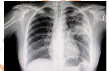
Ilustración de los resultados de una radiografía del torax en la que los pulmones se ven oscuros

La Radiografía conocida también como RX, es un estudio diagnóstico que utiliza radiación ionizante para ver los órganos del cuerpo. Las imágenes de rayos X muestran el interior de su cuerpo en diferentes tonos de blanco y negro. Esto es debido a que los tejidos absorben diferentes cantidades de radiación. El calcio en los huesos absorbe la mayoría de los rayos X, por lo que los huesos se ven blancos. La grasa y otros tejidos blandos absorben menos, y se ven de color gris. El aire absorbe la menor cantidad, por lo que los pulmones se ven negros. Es un examen rápido, indoloro y no invasivo. Según la parte del cuerpo a examinar lo acomodaran sentado, de pie frente a la máquina de RX o lo acostarán en una camilla que puede estar un poco fría y es probable que le indiquen que contenga la respiración por algunos segundos.